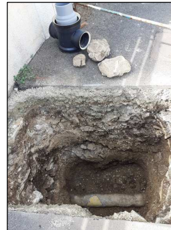
Trou avant pose d'un tabouret