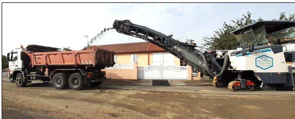
Rabotage rue des Tamaris