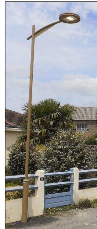
Nouveau candélabre rue de la Mairie