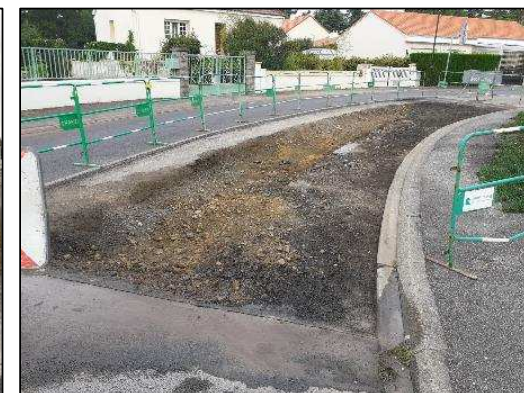
Purge rue du Beau Soleil