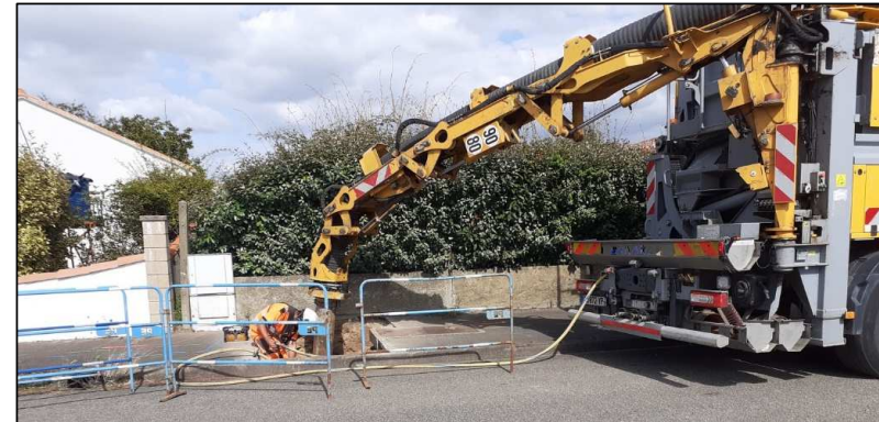
Aspirations des gravats pour dégager la canalisation