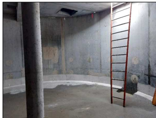
Vue intérieure du bassin avant appareillage