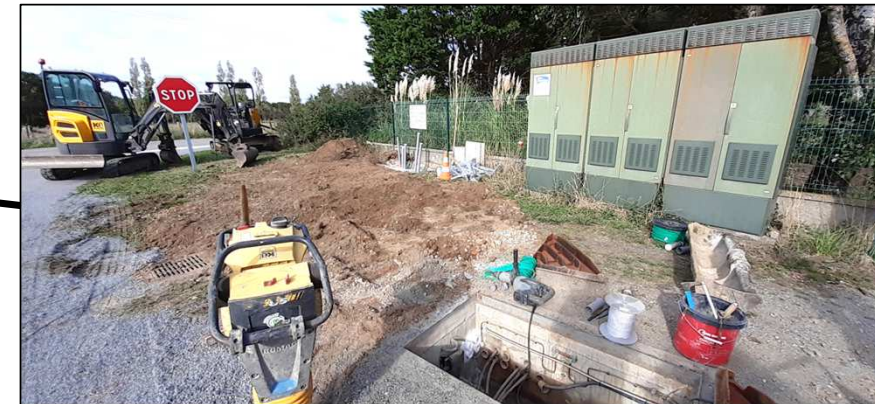
25-09-2023 – Travaux préparatoires à la pose du SRO à la Pitardais

A partir de mars 2024 : commercialisation