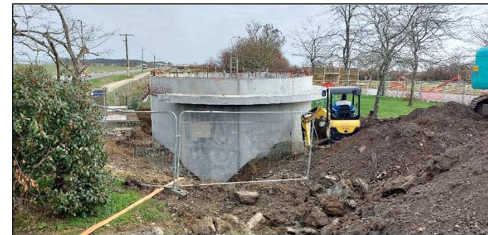
Havage du bassin