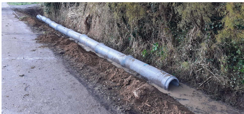
Pose de buses de 400 mm en béton armé pour « stabiliser la route »