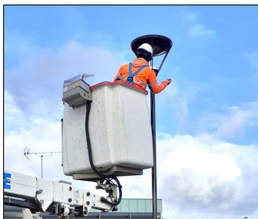
Fixation d'un luminaire sur son mât rue des Prés