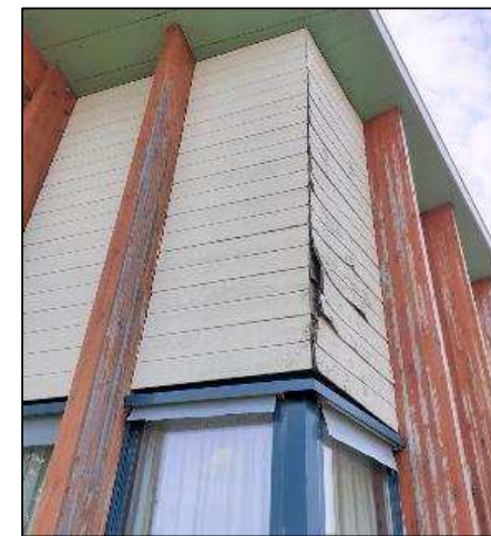
Avant reprise bardage et traitement poteaux salle de motricité de l'école