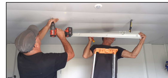
Dépose d'un néon aux vestiaires de foot