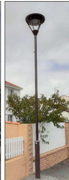
Nouveau candélabre rue de l'Étang