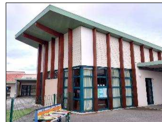
Après reprise bardage et traitement poteaux