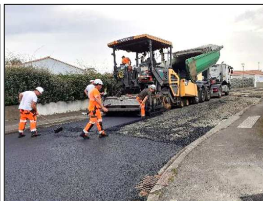
Pose du BBTM rue des Tamaris