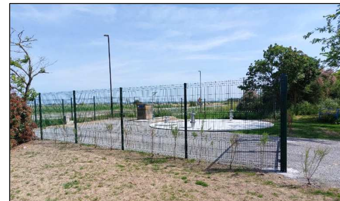
Poste de relèvement actif au 26 mai 2023