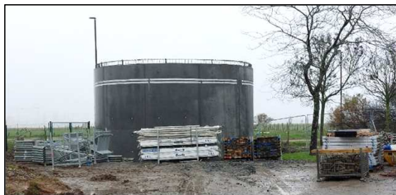
Viroles bétons coulées

Les travaux en images : octobre 2022 à fin mai 2023