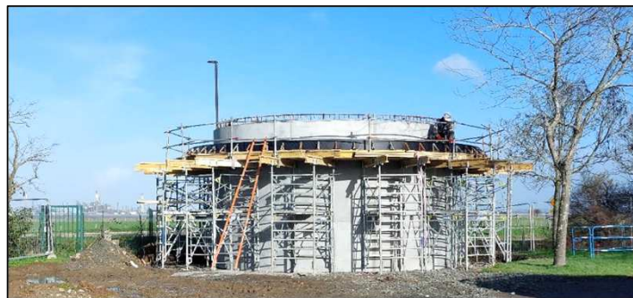
Réalisation de la collerette périphérique