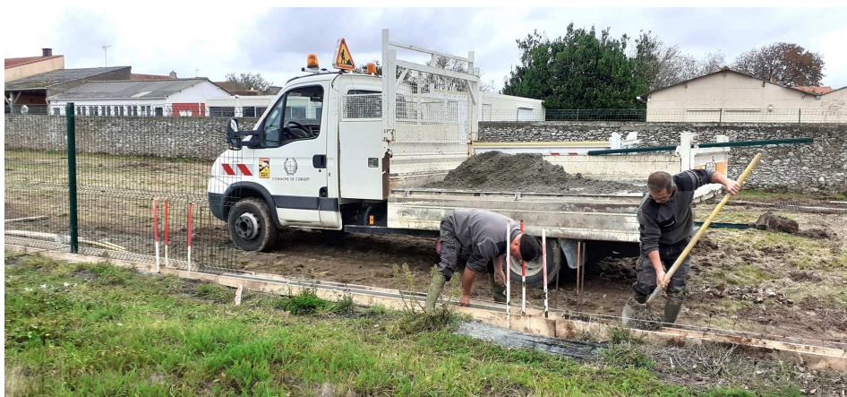
Pose des poteaux et du grillage sur la parcelle AA507 attenante à l'école