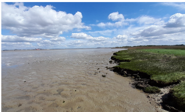
Vasière et prés salés au large de Corsept - Conservatoire du littoral, délégation Centre Atlantique

Sa situation dans l'Estuaire de la Loire soumet Corsept à une double influence fluviale et océanique. Ainsi, tandis que les marées font apparaître et disparaître la vasière au large de la digue, les marais et les cours d'eau de Corsept rappellent les liens de la commune à la Loire et son implantation dans la plaine alluviale.