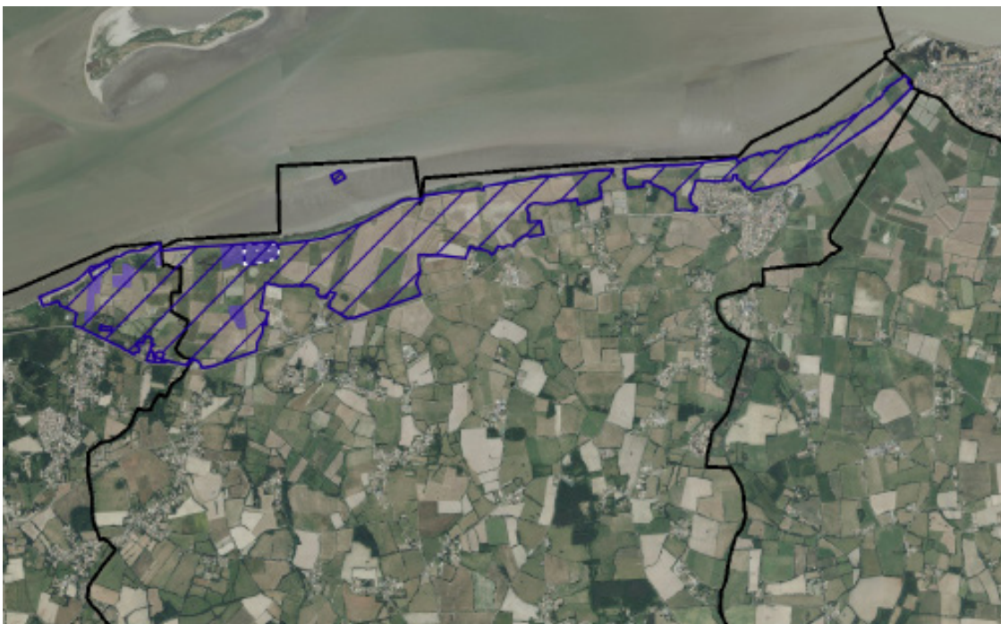
Périmètre d'intervention du Conservatoire du littoral (en bleu) à Corsept et Saint-Brévin-les-Pins

C'est un établissement public de l'Etat qui a pour but la préservation à long terme des espaces littoraux, et du capital naturel et historique. Pour réaliser son action, le Conservatoire du littoral est susceptible d'acquérir des terrains lorsque ceux-ci sont mis en vente afin d'y développer des études, des travaux de restauration, des aménagements permettant l'accès au public de certains espaces. Les parcelles concernées sont celles inscrites dans le périmètre d'intervention validé avec l'accord du Conseil municipal. Un périmètre de préemption peut aussi être mis en place sur cet espace par le Département dans le cadre de sa politique de gestion d'espaces naturels sensibles. Sur ce modèle, le Conservatoire du littoral intervient dans l'Estuaire de la Loire sur plus de 10 communes et est propriétaire de 2 700 ha gérés par le département. La commune de Corsept a souhaité disposer de ces deux outils sur un périmètre situé entre la digue de Corsept et la route départementale 77.