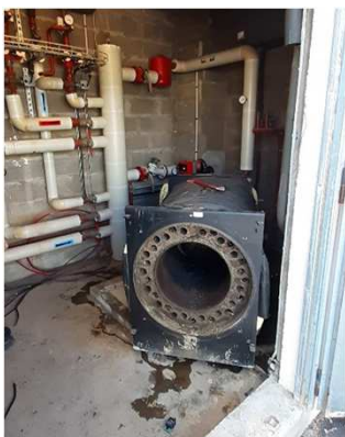
Dépose de l'ancienne chaudière