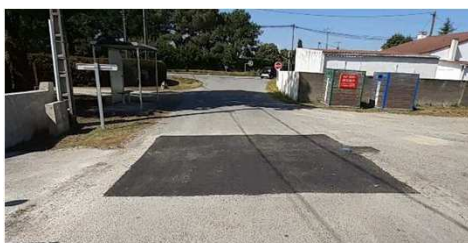
Purge à la Baie de Loire