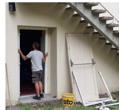
Remplacement d'une porte au Pasquiaud