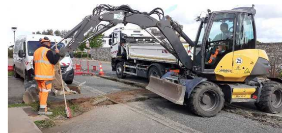
Rue de l'Estuaire : creusement d'une tranchée pour le passage des fourreaux

* Rénovation initiée par le mandat précédent