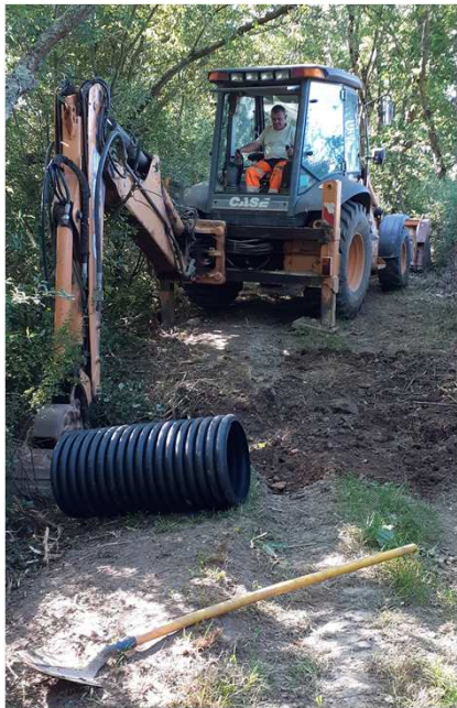
Pose de buses dans le chemin les Renauderies-la Haute Lande