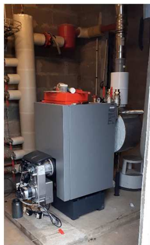
Pose de la nouvelle chaudière