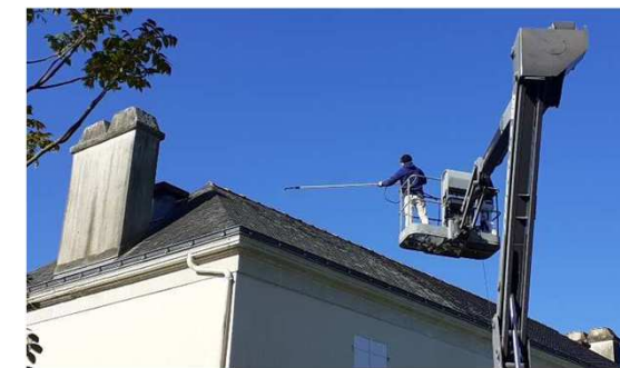
Traitement toiture Pasquiaud