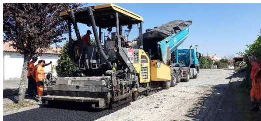
Pose enrobé au finisher dans la rue de la Pierre Bonde