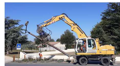
RD 77 : enlèvement ancien candélabre