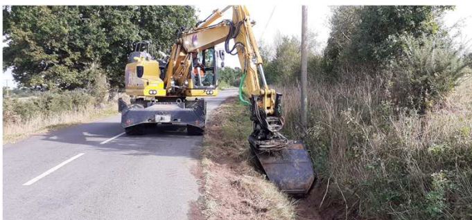
Curage au niveau de la Mouraudière