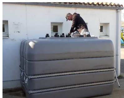
Pose des cuves et raccordement