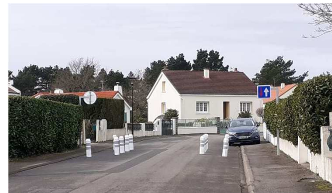
Ecluse simple rue du Beau Soleil