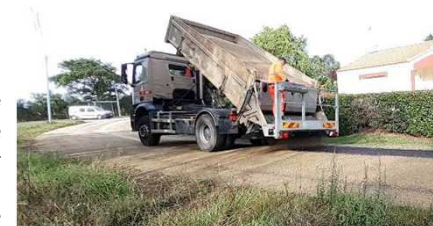
Pose 2 ème couche gravier sur liant à la Franquinerie