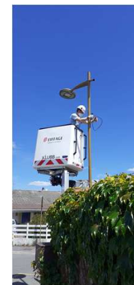
Rue de l'Estuaire : Montage candélabre