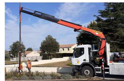
RD 77 : pose nouveau candélabre